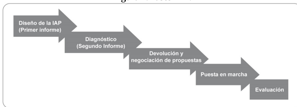
Figura 1. Fases IAP.