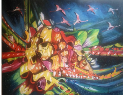
Pájaros en otra dimensión