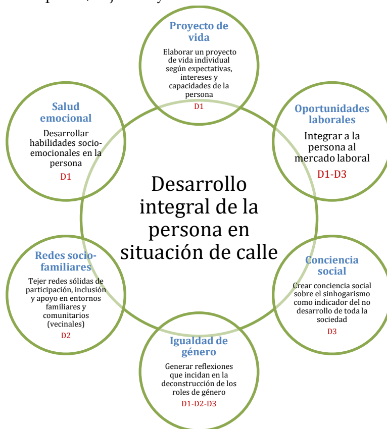
Figura 3. Aspectos, objetivos y dimensiones del modelo tridimensional.

El objetivo principal de intervención de este modelo es el desarrollo integral de la persona que está en situación de calle. Para ello, y de acuerdo a los aspectos que se pretenden abordar y que desde esta propuesta son básicos para que el objetivo principal se cumpla, se han delineado seis objetivos particulares: 1) elaborar un proyecto de vida individual de acuerdo a las expectativas, intereses y capacidades de la persona; 2) integrar a la persona al mercado laboral; 3) desarrollar habilidades socio-emocionales en la persona; 4) tejer redes sólidas de participación, inclusión y apoyo en los entornos familiares y comunitarios (vecinales); 5) generar reflexiones que incidan en la deconstrucción de los roles de género y en la igualdad de género; 6) crear conciencia social sobre el sinhogarismo como indicador del no desarrollo de toda la sociedad.