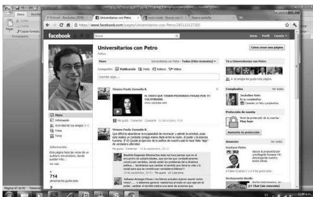
Gráfica 1 Pagina Facebook de Universitarios con Petro

Del nuevo territorio aparece la reflexión sobre el lenguaje, y dentro de los diferentes tipos de lenguaje, el lenguaje visual cobra protagonismo en el ciberespacio (como se ve en la gráfica 1) y reconfigura los modos de comunicarse de los participantes, en donde notablemente, como dice el refrán, “una imagen vale más que mil palabras”. Son muchas las publicaciones de videos y fotografías que buscan siempre comunicar ideas, afectividades, posturas, identidades, historias, momentos e incluso estados de ánimo, como lo demuestran las fotos e imágenes, adjuntadas en los perfiles, incluidas en las gráficas 1 y 2.