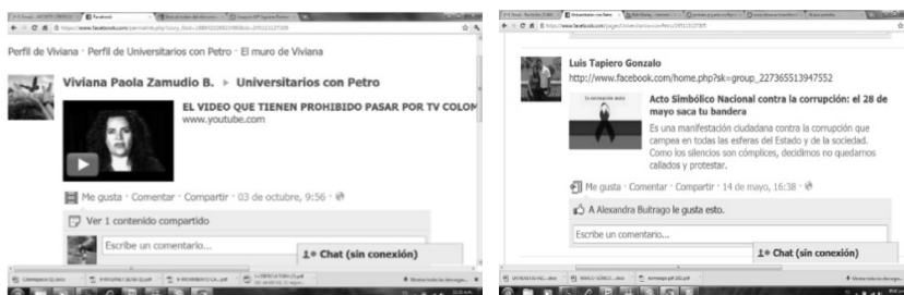
Gráfica 3 El hipervínculo

No se puede hablar del lenguaje que circula en esta página de Facebook sin acudir al hipertexto, nombre que fue adoptado por Theodor H. Nelson según Calvo (2002) para describir una forma de escritura electrónica no secuencial. Es un texto configurado de un texto bifurcado, integrado por bloques y nexos llamados hipervínculos, que permiten al receptor la elección de distintos itinerarios de desarrollo y resolución de la lectura (Calvo 2002).