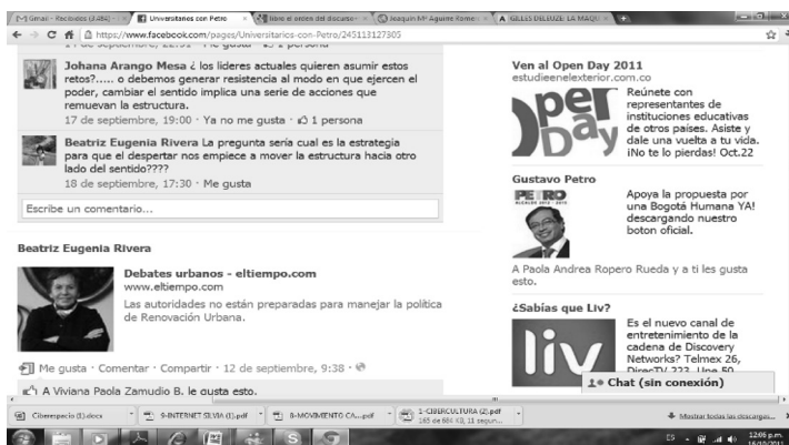
Gráfica 5. Propaganda en el lado derecho de Facebook

Las dinámicas de Facebook, ahora muy bien estudiadas y reproducidas por el poder económico, como lo demuestra la columna del lado derecho (ver gráfica 5), en la cual se realiza toda clase de publicidad diseñada para las inquietudes que se han demostrado a lo largo de la historia en la participación que se realiza en el propio muro y en el de otras personas, así como la información que se refleja a través de las fotos, produce una imagen entre la relación de realidad y consumo, y a la vez entre consumo y producción, generando una imagen de cotidianidad y de verdad: