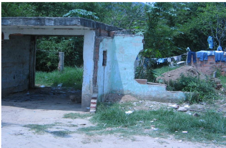
Figura 3: Vivienda del asentamiento Convivir, después de la inundación de 2005.

un tratamiento especial. De acuerdo con el decreto 2411 de 1974 y el Decreto 1449 de 1977 se señala que se deberán mantener una faja no inferior a 30 metros de ancho, “paralelo a las líneas de mareas máximas, a cada lado de las rondas de los ríos, quebradas y arroyos”, sin embargo, en el caso del municipio de Girón, es precisamente en estas zonas donde se ubican los asentamientos humanos precarios como Convivir, exponiéndose esta población a padecer eventos desastrosos como la inundación de febrero de 2005 y sufriendo las consecuencias no buscadas de esta acción (Ver figura 3).