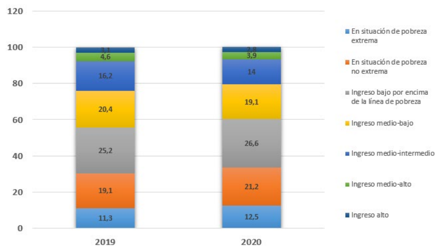
Figura 1. América Latina (18 países) a: población según estratos de ingreso per cápita, 2019 y 2020 (En porcentajes).