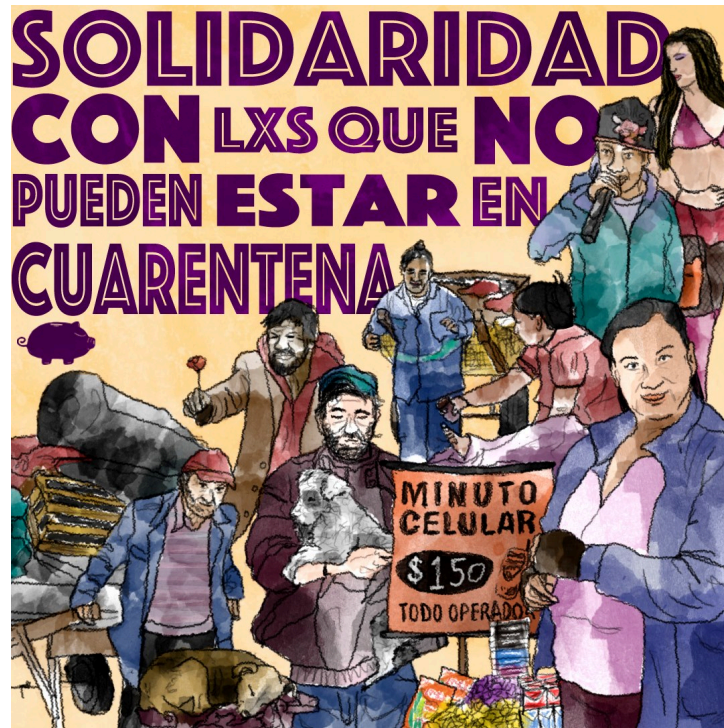
Solidaridad Colectivo El Marrano de Barro