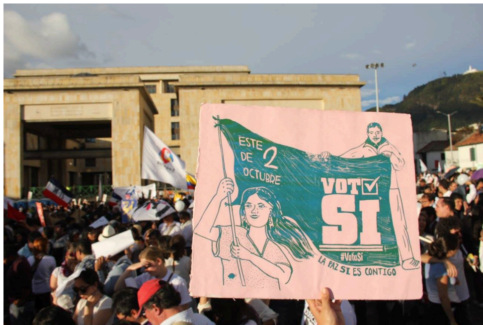
Voto sí Colectivo El Marrano de Barro