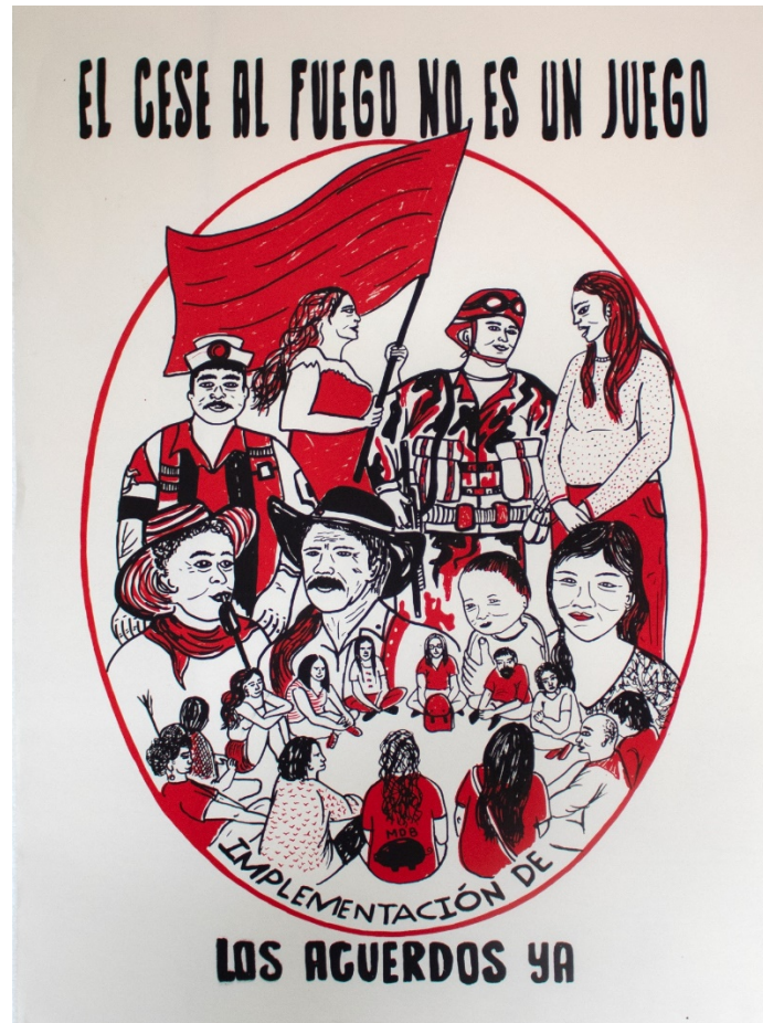
Cese Colectivo El Marrano de Barro