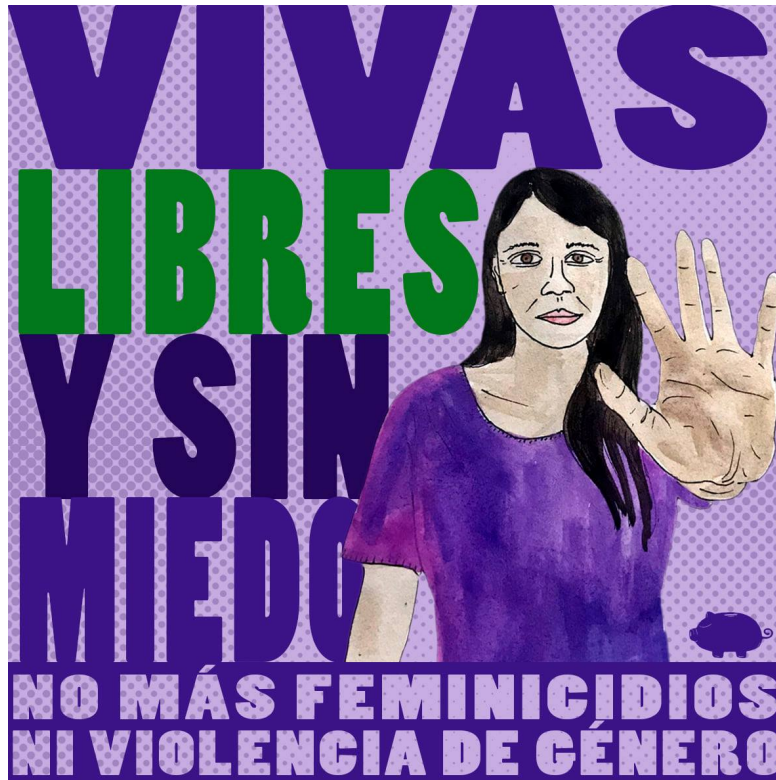
Vivas, libres y sin miedo Colectivo El Marrano de Barro