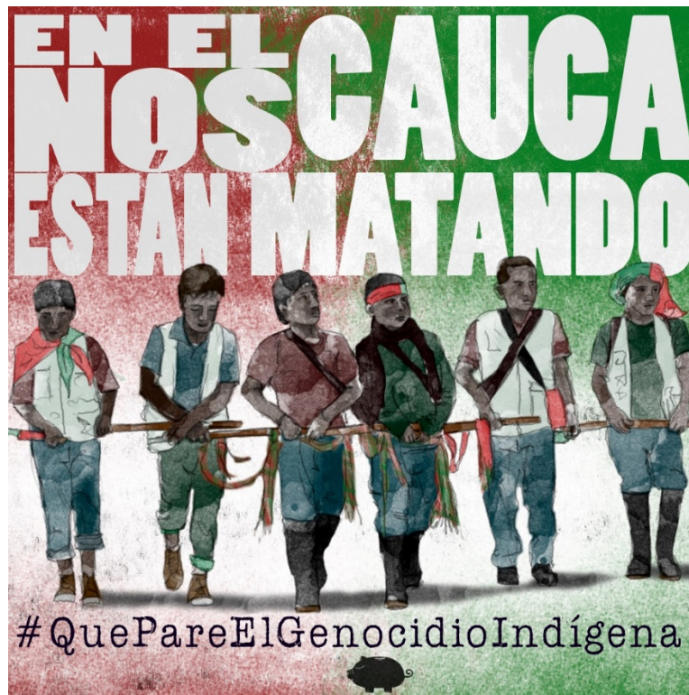
Genocidio Colectivo El Marrano de Barro