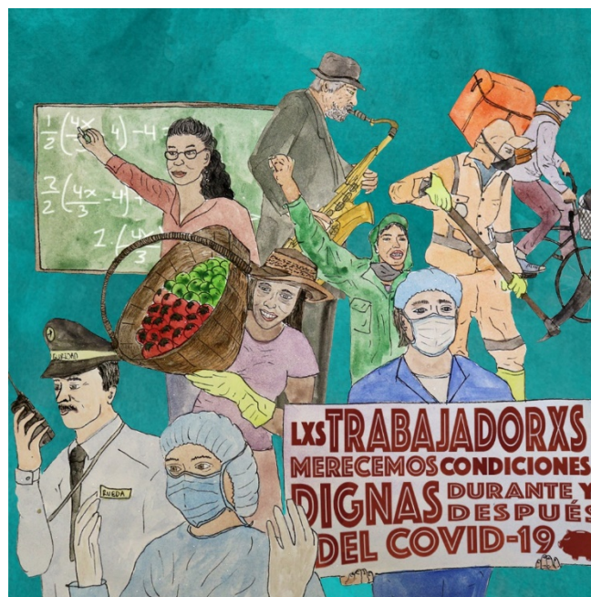
Condiciones dignas Colectivo El Marrano de Barro