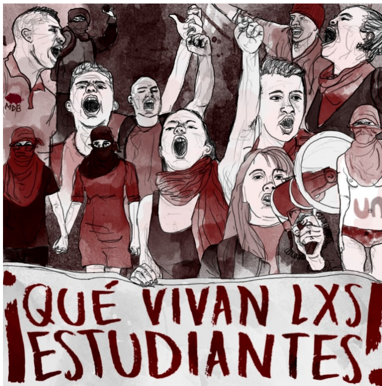
Estudiantes Colectivo El Marrano de Barro