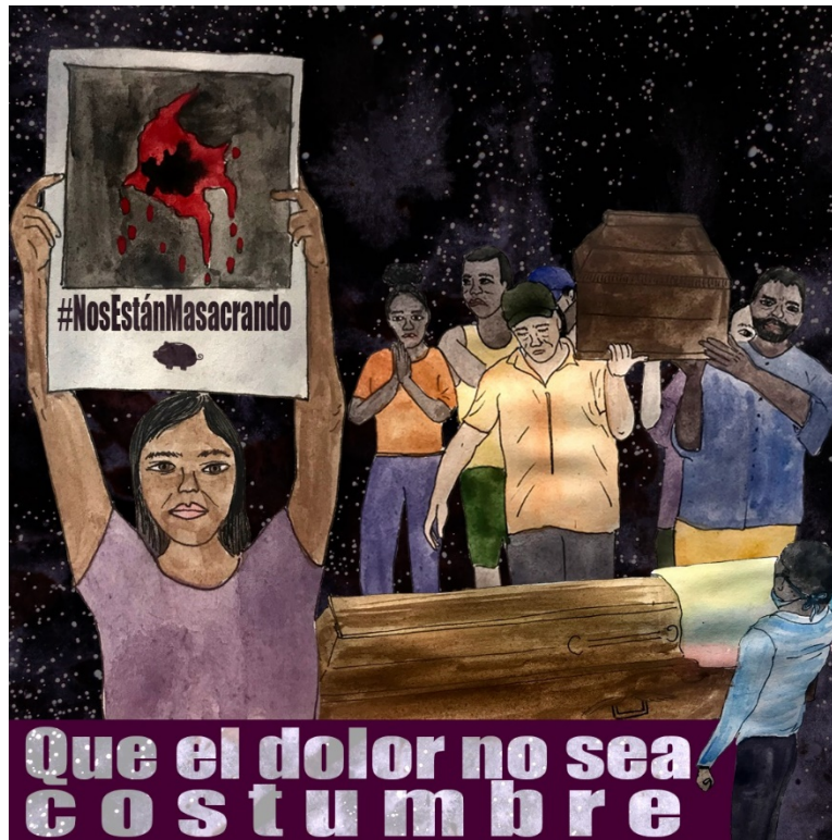
No más masacres Colectivo El Marrano de Barro