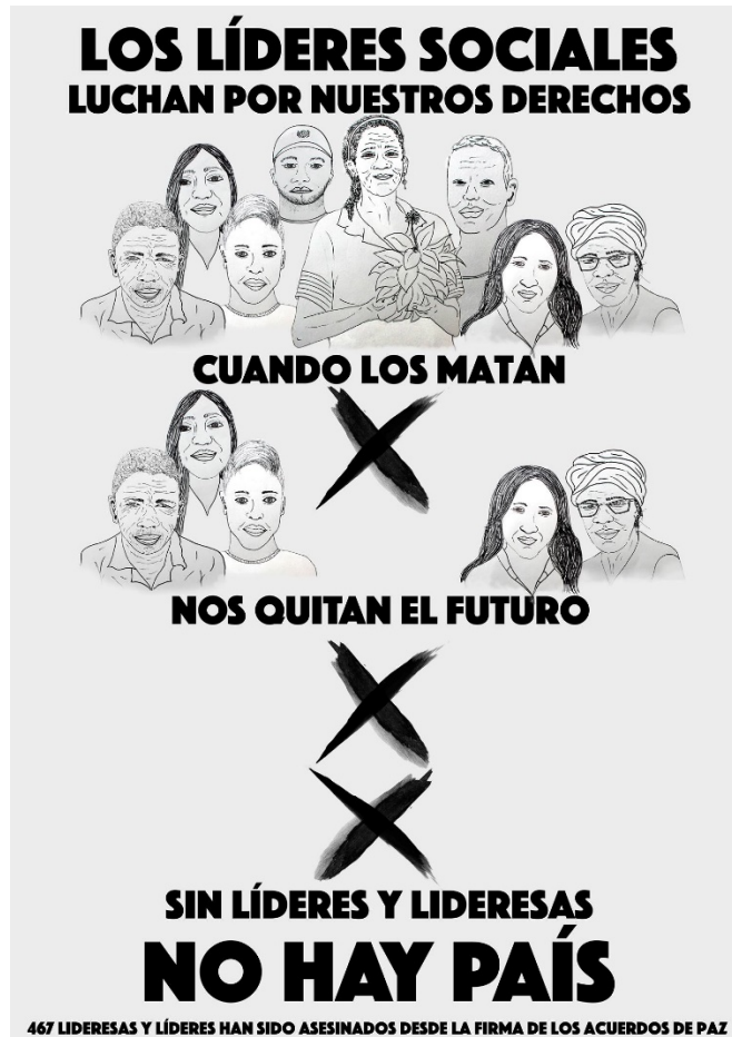
Líderes, homenaje Colectivo El Marrano de Barro